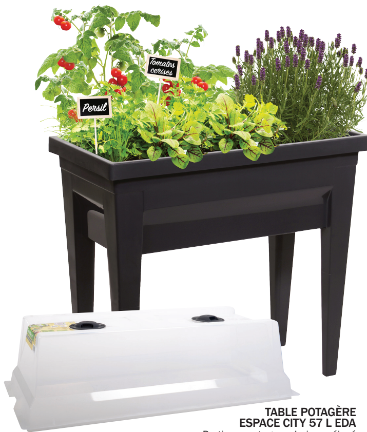
TABLE POTAGÈRE ESPACE CITY 57 L EDA

Pratique, potager urbain surélevé idéal sur le balcon ou la terrasse. Zone de rétention d'eau : optimisant l'irrigation. Evacuation trop plein d'eau par les pieds Dimensions: 76 x 38,5 x 68 cm